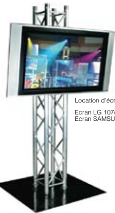
Location d'écran plasma :

Ecran LG 107cm 42" + pied alu design : 160€ HT / jour (tarif dégressif) Ecran SAMSUNG 127cm 50" + pied alu design : 220€ HT / jour (tarif dégressif)